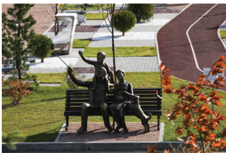
Жилой комплекс KASKAD PARK