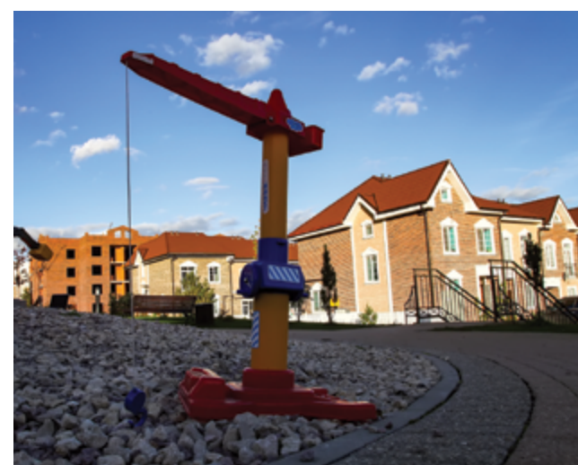
Жилой комплекс «Домодедово Таун»