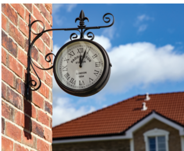
Жилой комплекс «Сабурово Парк»