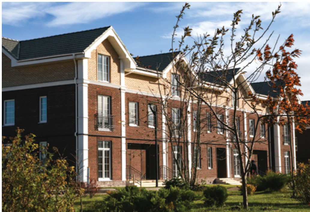
Жилой комплекс KASKAD PARK

Осень – это время, когда принято подводить итоги если не года, то во всяком случае, лета. В этом году лето задержалось в жилых комплексах KASKAD Family. Давайте вместе прогуляемся по непривычно зеленым даже в октябре бульварам и аллеям!