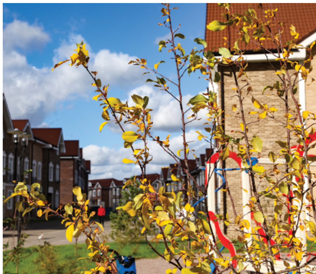
Жилой комплекс «Сабурово Парк»