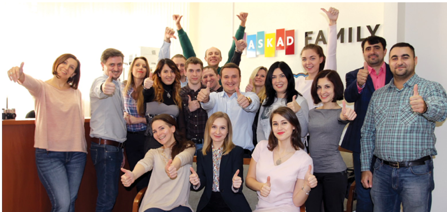
Сегодня в дружном коллективе KASKAD Service более 20 сотрудников