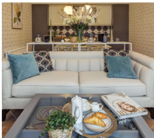
Шоу-рум в ЖК KASKAD Park

Очень важная часть развития заложена в команде. Мы видим, что эффективность работы зависит от множества факторов, которые мы развиваем посредством обучения, тренингов, совещаний, сравнения эффективности и постоянного анализа полученного результата.