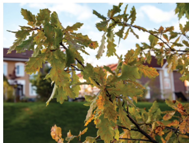
Жилой комплекс «Домодедово Таун»