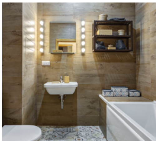
Шоу-рум в ЖК KASKAD Park