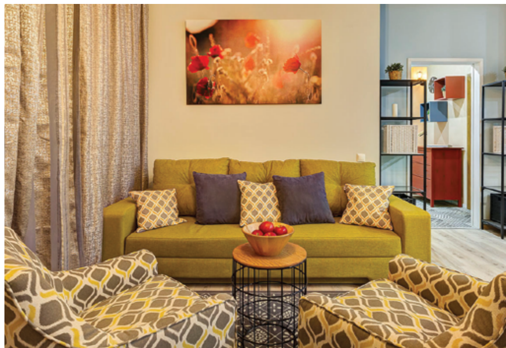
Шоу-рум в ЖК KASKAD Park