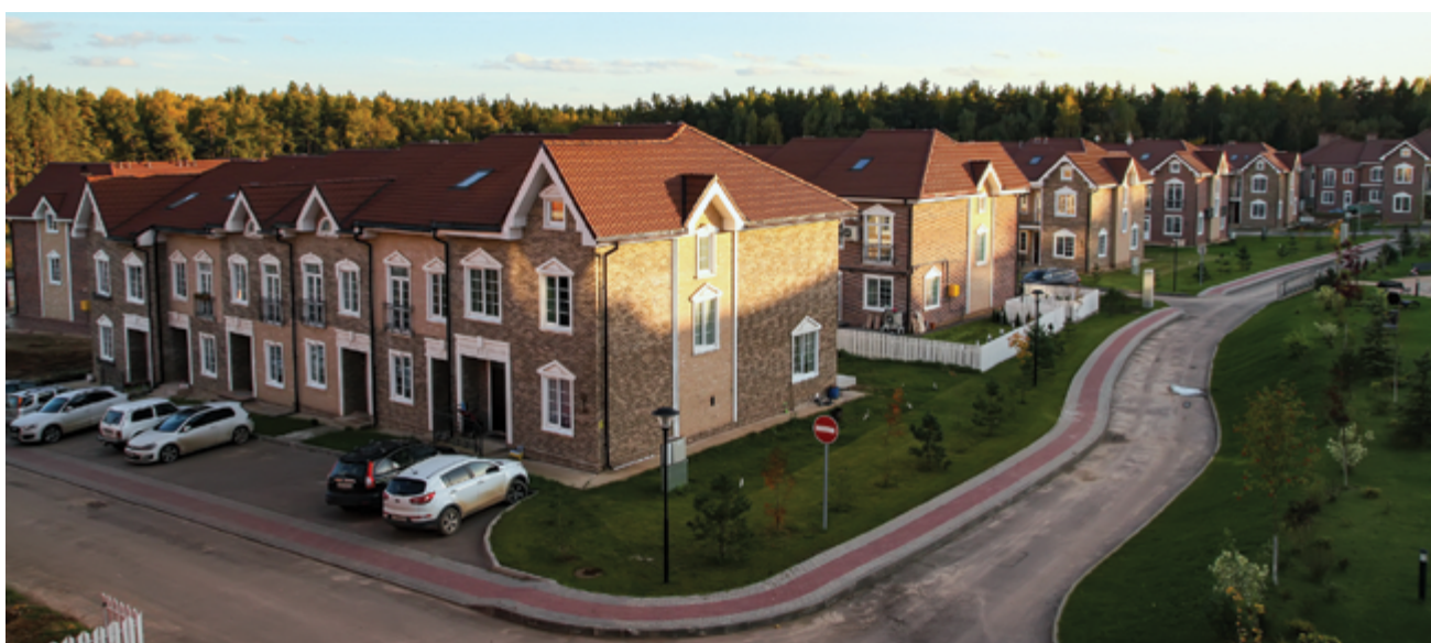
Жилой комплекс «Домодедово Таун»